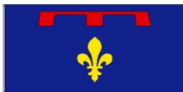
Drapeau de la Provence angevine